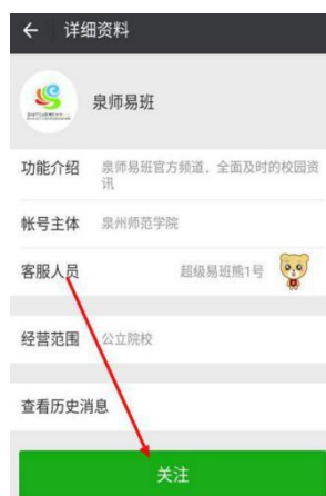
图 2 微信公众号资料页面

2. 在公众号首页，点击第三个小菜单【在线课程】→【安全微课】，即可进入系统，如图 3。