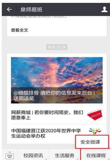
图 3 微信端课程入口

2. 在公众号首页，点击第三个小菜单【在线课程】→【安全微课】，即可进入系统，如图 3。