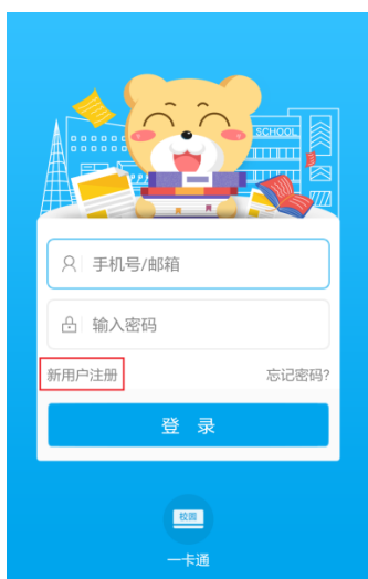
图 11 易班登录页

2. 注册/认证账号。进入软件，点击“新用户注册”进入注册页面，使用手机号进行注册，如图 11-12。注册完成后，通过学号或工号进行校方认证，如图 13。