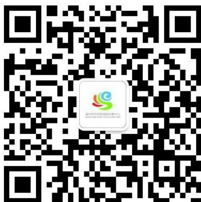
图 1 泉师易班微信公众号二维码