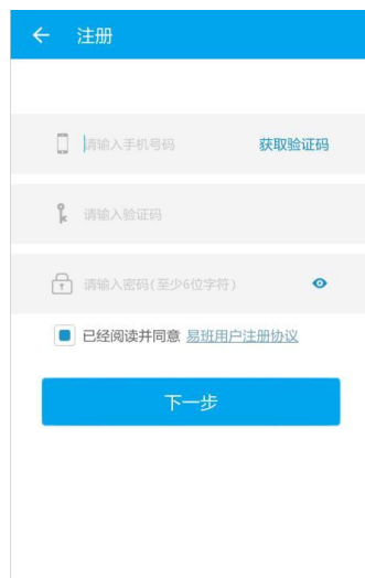
图 12 易班注册页