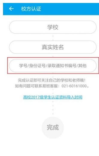
图 13 校方认证页