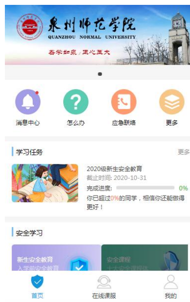
图 7 课程首页