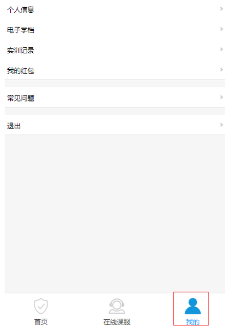
图 9 学习档案界面