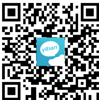
图 10 易班 APP

1. 下载易班。扫描图 10 二维码，或在手机“应用商城”下载最新版易班 APP。