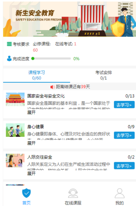
图 8 课程列表页