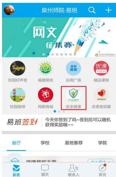
图 6 易班客户端课程入口

1. 打开易班 app，登录易班，在首页热门应用找到【安全微课】，点击即可进入课程，如图 6-7。